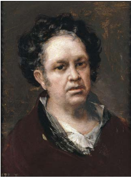
Autoportrait , 1815, musée du Prado, Madrid